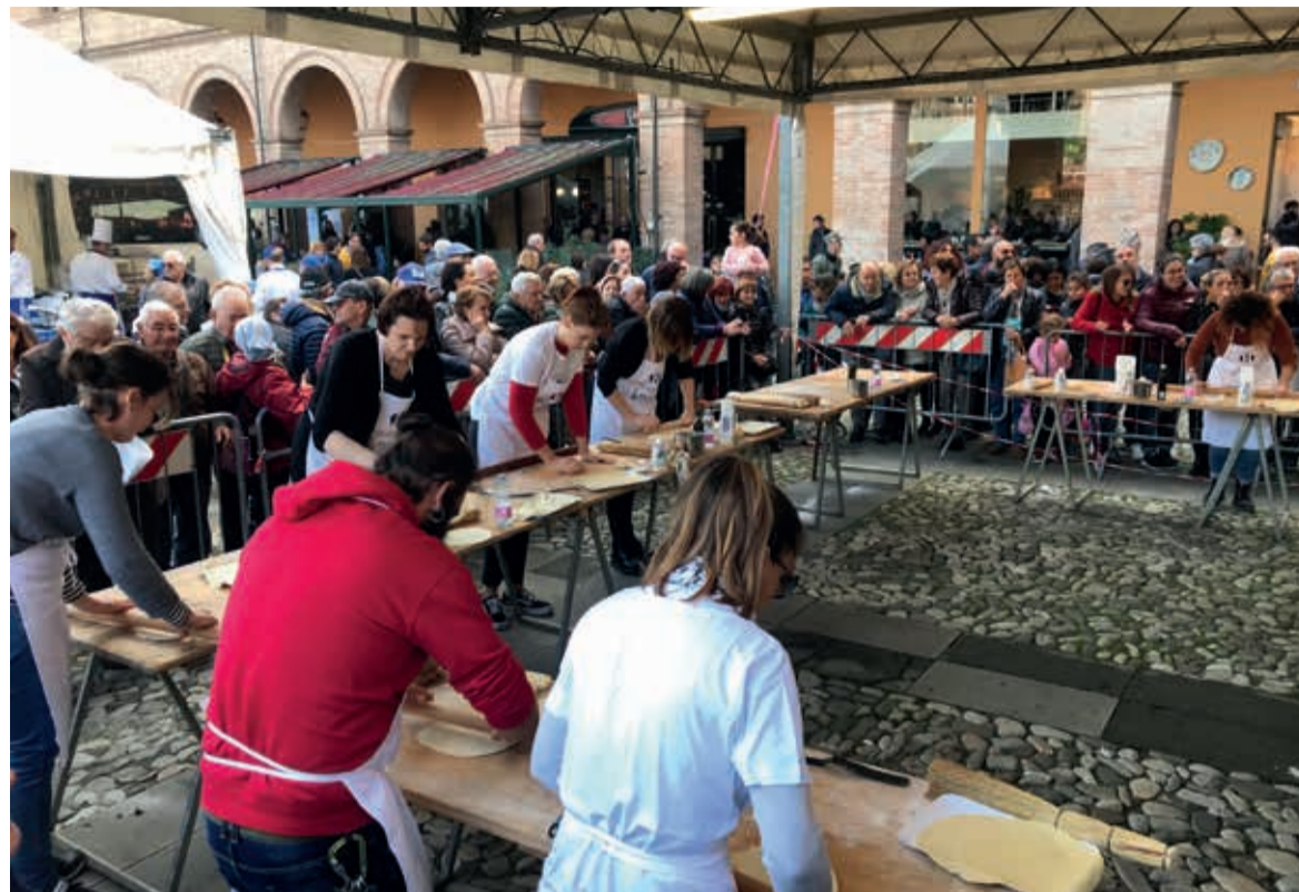
Gli sfidanti al Palio della Piada in una precedente edizione

Da venerdì 10 a domenica 12 novembre la più attesa delle Fiere d'Autunno