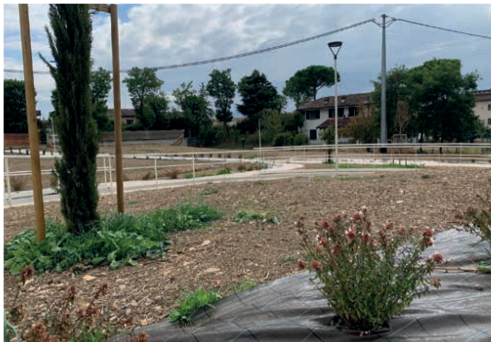
Il nuovo parco del Macabucco in fase di completamento

È un parco insolito quello del Macabucco, fra la Santarcangiolese e via Contea. L'area verde distante solo qualche centinaio di metri dal centro città è diventata un parco tematico capace di integrare parti importanti della storia locale riguardante i resti di fornaci per la produzione di ceramica e laterizi, di una strada e di una villa rustica di epoca romana rinvenuti durante gli scavi effettuati nel 2006 e rimasti sepolti nel terreno, con aree ludiche e al tempo stesso esplorative. Collegato con il parco dei Cappuccini attraverso i percorsi lungo il fiume Uso, il Macabucco si presenta come sintesi e punto di divulgazione per famiglie, scuole e singole persone, offrendo passeggiate educative alla scoperta delle tracce rilevate dagli archeologi e momenti di relax in un ambito culturale di grande spessore. Una fontana di acqua potabile posta nella piazza a ridosso della collinetta rimanda all'antica fonte Macabucco, mentre la zona barbecue con tanto di pergolato può contare su tavoli e panche in legno. Oltre a un gazebo quale zona di lettura, il parco è dotato di diverse attrezzature ludiche adatte anche per un uso inclusivo. Circa 400mila euro il costo dei lavori finanziati in buona parte dal fondo Covid.