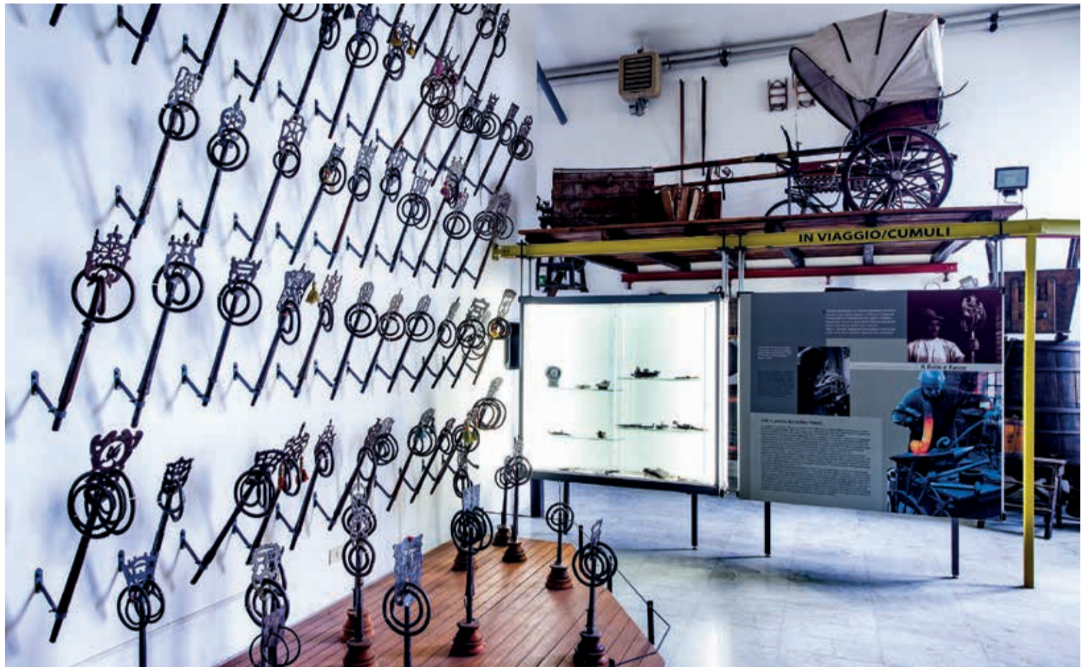
Museo etnografico, sala delle caveje

una segnaletica inclusiva e contenuti accessibili e innovativi, il progetto prevede anche la realizzazione di ricerche e percorsi di formazione specifica per il personale, che hanno preso avvio proprio nelle scorse settimane e che proseguiranno nel corso dell'autunno (vedi pagina 8).