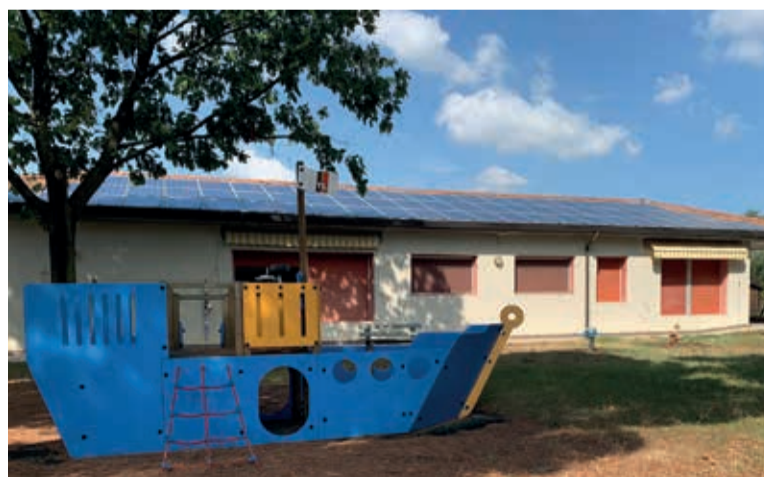
Il nido d'infanzia Mongolfiera in via Guido Rossa

Tre le sezioni previste, a cui si aggiunge un'aula da adibire a spazio civico, che in caso di necessità potrà portare a quattro le sezioni del plesso. L'edificio è inoltre dotato di pannelli fotovoltaici e solari oltre che di un sistema di ventilazione naturale. Saranno gli alunni assieme alle loro insegnanti a proporre all'Amministrazione comunale il nome da dare alla nuova scuola.