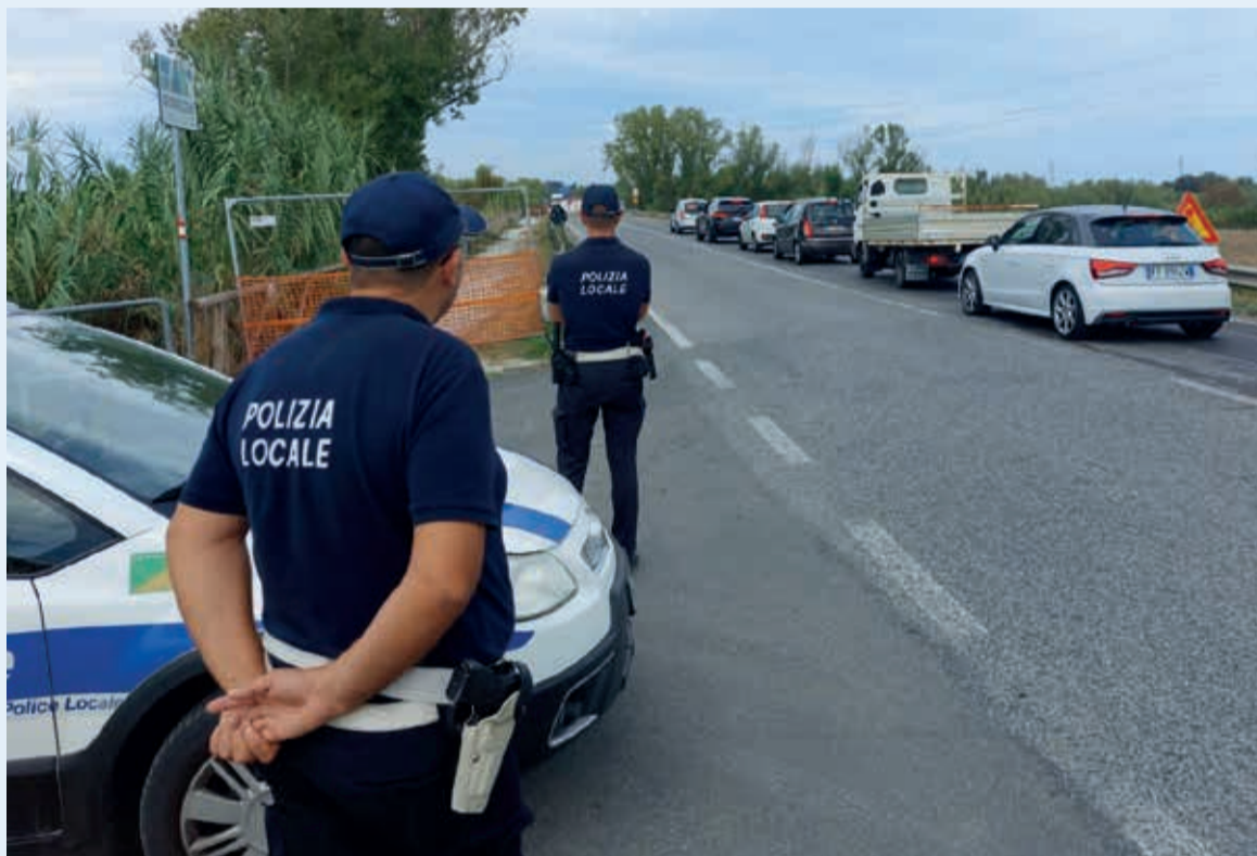
Una pattuglia a presidio della viabilità sul ponte Marecchia

ti possono rivolgersi per segnalazioni o altre richieste – relative ad esempio all'efficienza della segnaletica e delle infrastrutture stradali – che verranno poi riportate di volta in volta agli enti competenti.