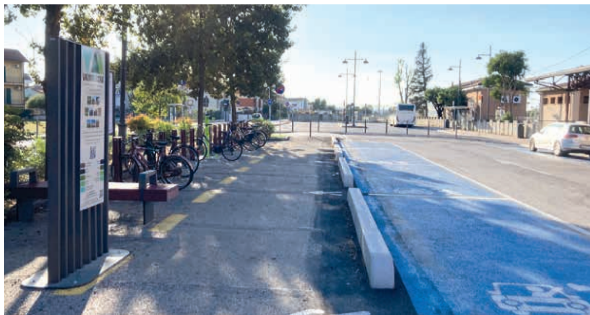
Piazzale Esperanto dopo la riorganizzazione dell'area di sosta

L'intervento – che ha comportato una spesa di circa 95mila euro finanziata dai contributi assegnati al Comune da Agenzia Mobilità Romagna attraverso la Regione Emilia-Romagna – rientra fra le azioni previste dal Piano urbano della mobilità sostenibile dell'Amministrazione co-